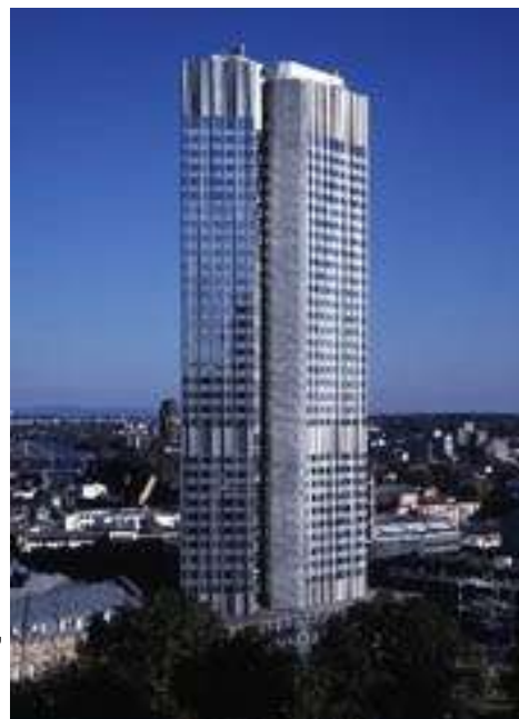
Ilustración 1 La Eurotower, sede del Banco Central Europeo en Frankfort, Alemania.

Alemania, Francia, Italia, Holanda, Bélgica, Luxemburgo, Irlanda, España, Portugal, Grecia y Finlandia (Ver Ilustración 2).