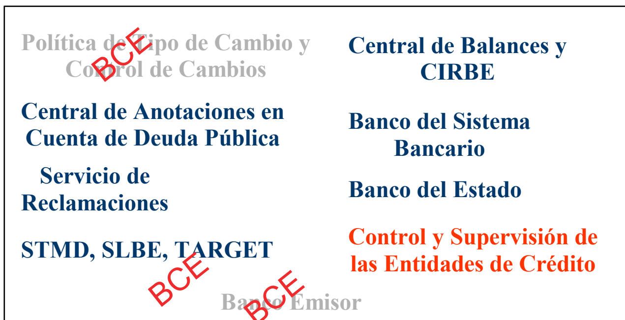
Ilustración 3 Funciones del BCE y del Banco de España. Las iniciales STMD, SLBE y TARGET hacen referencia a sistemas de pagos. La Central de Balances y el CIRBE son las oficinas de estadísticas e información del Banco de España.